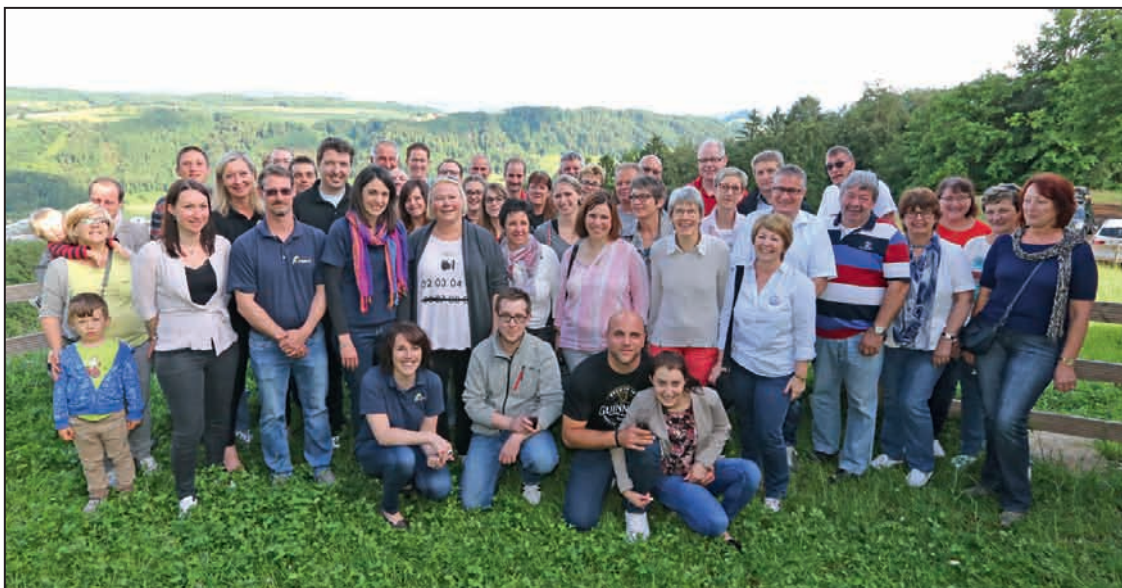
Une partie du Club des 100 sur la terrasse de la nouvelle cabane des Eclaireurs de Moudon