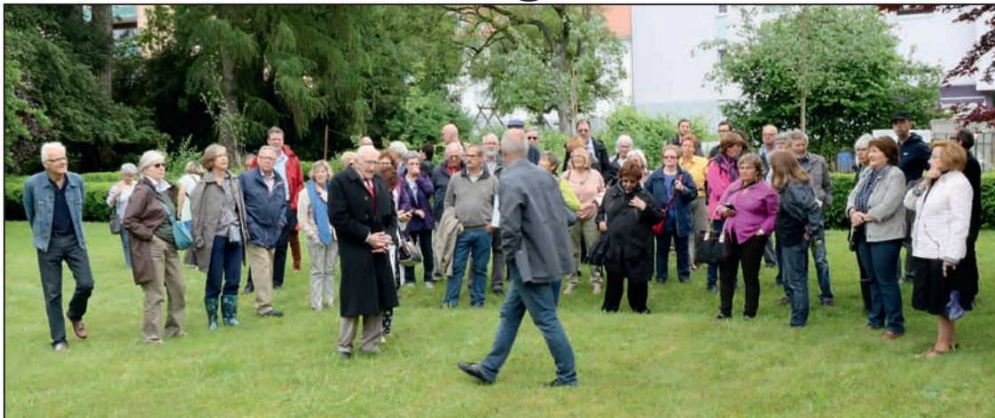
Un nombreux public a accouru