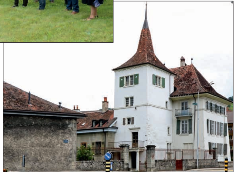
Vue générale du château

C'est en 1619 que le corps de logis a été reconstruit dans son volume actuel et que la tour aurait été érigée. Au cours des siècles, d'autres